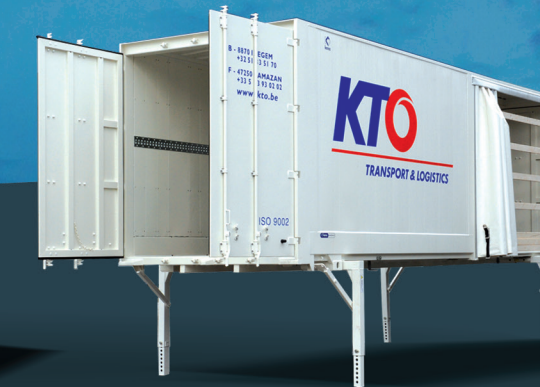
Nadstavba špeciálna s delenou bočnou plachtou

KEREX je od roku 1995 jedným z popredných výrobcov výmenných nadstavieb pre kombinovanú dopravu. Za túto dobu sa produkty firmy Kerex ďalej technologicky a kvalitatívne rozvinuli do vysoko kvalitných produktov. Rozmanitosť, inovácia a kvalita patria k základným pilierom každodennej výroby. Všetky verzie výmenných nadstavieb boli certifikované rôznymi Európskymi certifikačnými spoločnosťami (OBB, DB, DNV GL, Dekra Rina atď.) a spĺňajú všetky kritériá pre kombinovanú dopravu. Výrobný program naďalej vychádza z neustále sa zvyšujúcich požiadaviek trhu.