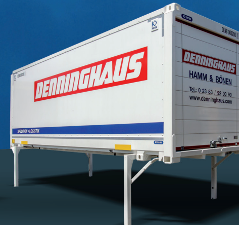
Nadstavba s plywood stenami