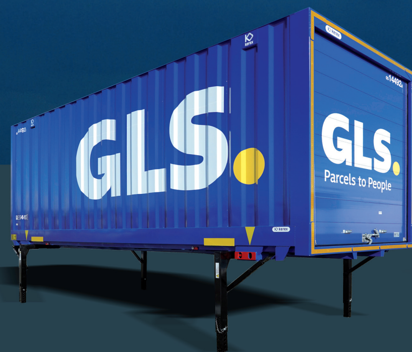
Výmenná nadstavba trapézová s rolovacími dverami

Viac ako 80% konštrukčných dielov je vyrobených z pozinkovaného plechu