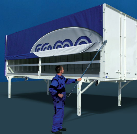
Výmenná nadstavba špeciálna plachtová