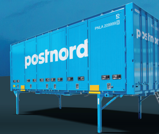
Nadstavba s hliníkovými bočnými dverami