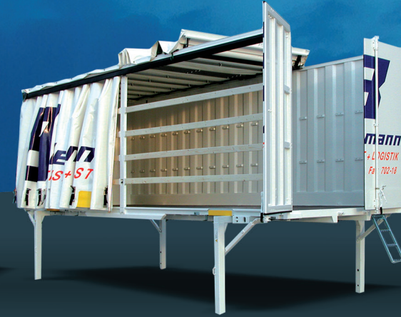
Nadstavba s odsúvacou bočnou a strešnou plachtou