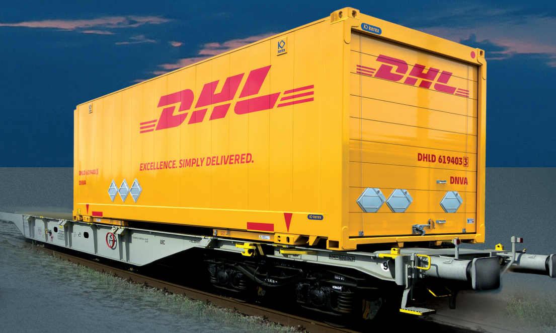
Výmenná nadstavba hladká s rolovacími dverami