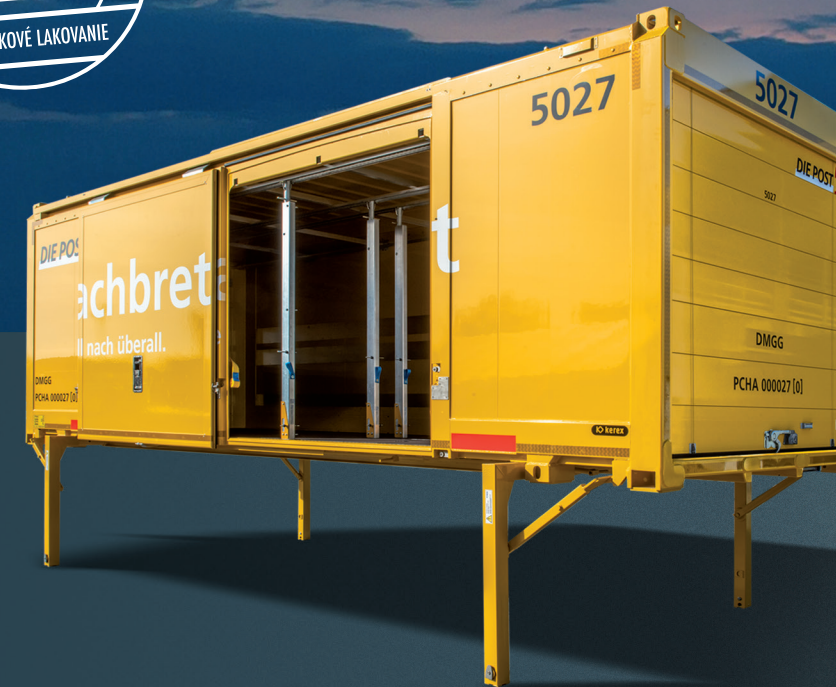
Výmenná nadstavba s odsúvateľnými bočnými dverami