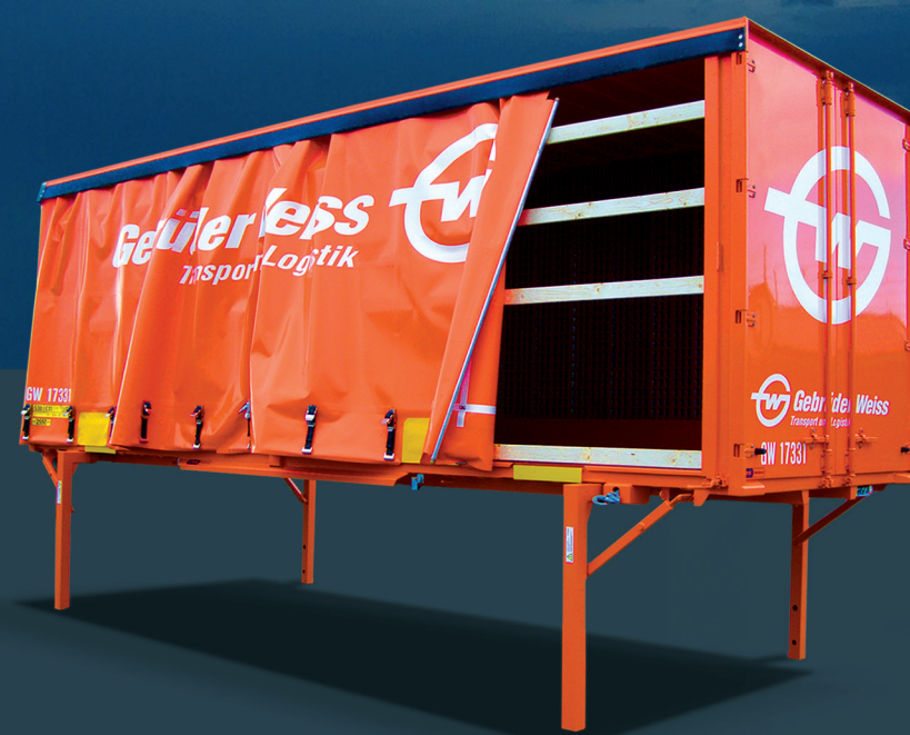
Výmenná nadstavba hladká s bočnou odsúvacou plachtou a kridlovými dverami